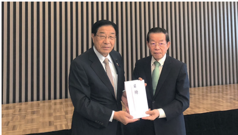
(新中日ビルにて)名古屋市長