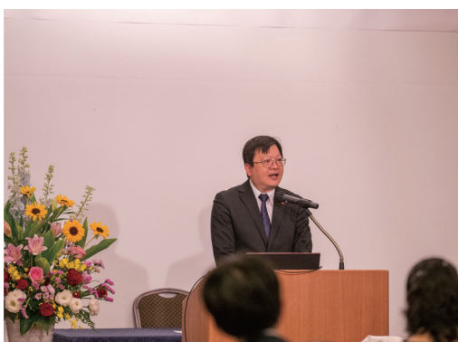
洪英傑台北駐大阪経済文化弁事処長によるごあいさつ