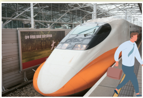
台湾新幹線 白とオレンジの配色で目を惹くデザイン

台湾新幹線(高铁)は、台北から南に伸びる高速鉄道で、移動時間を大幅に短縮できる観光にとっても便利な交通手段です。台北から台中までわずか一時間弱で到着できるため、日帰りで観光も可能です。台中に到着したら、豊かな自然を感じられる「霧峰林家花園」や台湾を代表する湖「日月潭」へ向かうのがおすすめです。日月潭では、遊覧船に乗って湖の中を巡りながら、四方にそびえる山々と湖面のコントラストが美しい風景を楽しめます。台中には、美術館や花博園など、文化的な施設も多く一日では足りないほどの見所があります。台湾新幹線を利用して、中部地方の絶景と文化を一度に満喫できる贅沢な旅をお楽しみください。