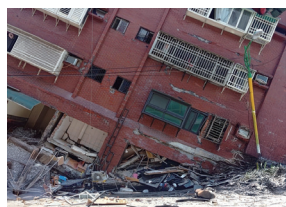
倒壊した花蓮県の高層ビル

ご協力ありがとうございました 法人:53社 160万円 個人:17名 30万円 合計 190万円