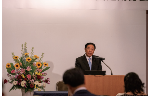
中川会長によるごあいさつ