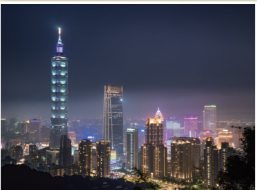
ライトアップされた台北101 昼夜を問わず多くの 観光客が足を運ぶ

台湾観光局は、現地の観光スポットを自宅で楽しむためのライブ配信観光サービスを展開しています。このサービスは、主に台北市内の人気観光地やイベントをライブ配信し、インターネットを通じてリアルタイムで現地の雰囲気を感ぜられるようにするものです。例えば、台北の文化的なイベントや観光スポットの臨場感を遠隔で体感することができます。今後はインタラクティブな要素も導入予定で、視聴者がガイドとリアルタイムで会話をしながら観光地を巡るバーチャルツアーも実現される予定です。この新しい観光スタイルは、忙しくて台湾を訪れる時間が取れない人や旅行前に下見として利用したい人にとっても非常に便利で、観光業界の新たな潮流を感じさせます。