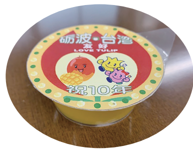
豆乳マンゴープリン