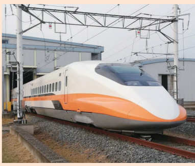
台湾高速鉄道の車両

台湾高铁の切符、2枚買えば1枚無料に 外国人観光客が対象 中南部での旅行促進で「観光署