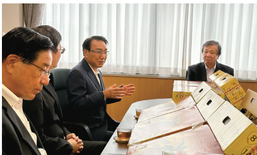
台湾マンゴー贈呈式