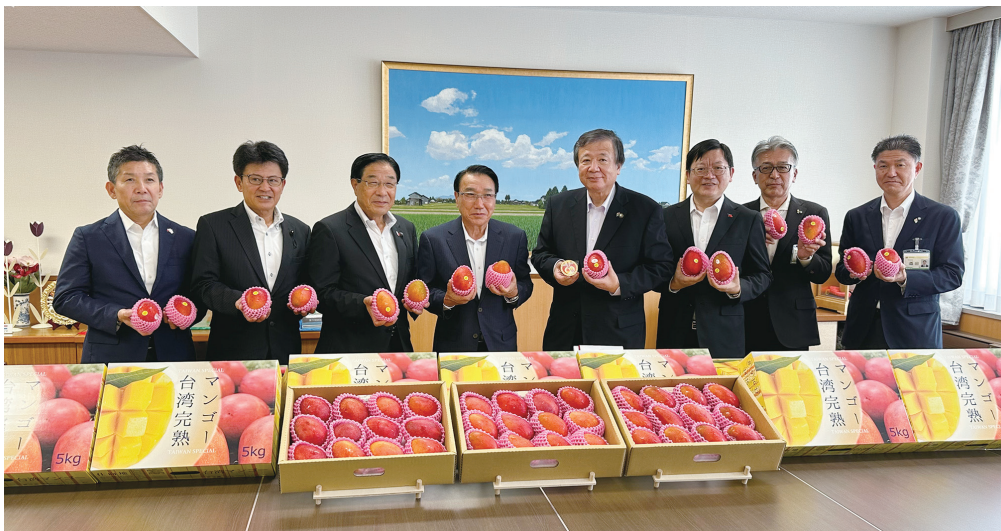
台湾マンゴー贈呈式

を手がけるR&Tグループ（富山市）が、市に200個寄贈。市と台湾嘉義市がチューリップを縁に交流を続けて10年の節目を迎えたこともあり、プリンのほかにも魯肉飯（ルーローハン）と麺料理の麺線（ミェンシエン）を「台湾友好給食」として提供した。