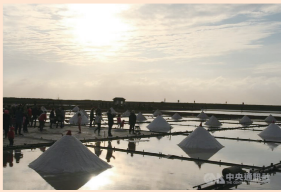
台南市の井仔脚塩田

台湾・台南、米CNNの「2024年に訪れるべき場所」に選出 グルメや景観など評価