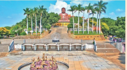
中部・彰化県の観光地、八卦山大仏風景区