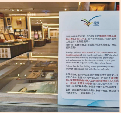
免税サービス専用のカウンターが設けられた国立故宮博物院の店舗

国立故宮博物院は17日、院内の売店や書店で海外からの旅行者を対象とした免税サービスを開始したと発表した。同院はインバンド市場の開拓に力を入れていることの表れだとし、積極的に旅行者に優しい環境をつくり、台湾の優れた文化観光体験を推進するとした。