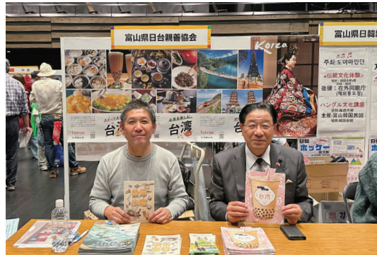
国際交流フェスティバル

● 11月12日 富山市で 「国際交流フェスティバル」 「国際交流フェスティバル」は、富 山市民国際交流協会などが県内 に住む外国人と市民との交流を 進めようと毎年開いていて、12日 は、富山市の会場で国際交流を行 う20の団体と25の国の出身者が 参加した。