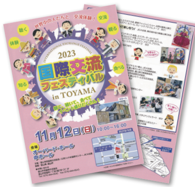
国際交流フェスティバルチラシ

今年も「台湾フェアinとやま」を 7/14 (日) に開催予定です！ 皆様のお越しを お待ちしております！