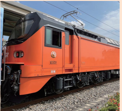
東芝製のE500型電気機関車

台湾鉄路管理局(台鉄)は28日、南部屏東県の潮州車両基地で、新たに導入する東芝製のE500型電気機関車を般に公開した。台鉄によると、会場には関係者や鉄道ファンら6千人以上が詰めかけ新車両の「仲間入り」を歓迎したという。