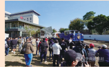
改修工を終えた北門駅(嘉義市)でお披露目した「栩悦号 Vivid Express」

農業部(農業省)林業自然保育署阿里山林業鐵路文化資産管理処は25日、同鉄道の開業111周年を祝い、改修工を終えた北門駅(嘉義市)で、旧型車両を改装した「栩悦号 Vivid Express」をお披露目した。駅には多くの鉄道ファンが詰めかけ、車両にカメラを向けたり、乗車体験をしたりして楽しむ姿が見られた。