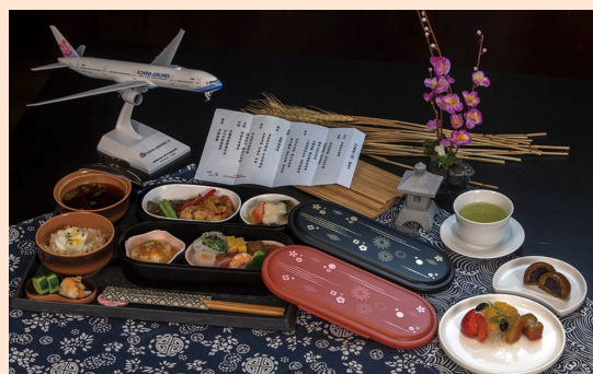
チャイナエア、日本線ビジネスクラスで懐石料理 東京の老舗とコラボ

（台北中央社）チャイナエアライン（中華航空）は15日から日本線のプレミアムビジネスクラスとビジネスクラスで東京の老舗とコラボレーションした懐石料理の提供を始める。10日発表した。