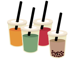
▲2022年8月21日 北日本新聞掲載

める家族連れらが列をつく った。台湾出身のシンガー ・ソングライターのコンサ ートや富山グランドプラザの トークショーもあった。 フェア実行委員会が3年 ぶりに開いた。15周年を迎 える県日台親善協会と県台 湾総会が協賛した。北日本 新聞社後援。