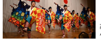
高知「よさこい踊り」の パフォーマンスを披露

杯で交流会が和やかな雰囲気ではじ り、盛会に開催されました。 16日は、高知市内調査視察が3コー スに分かれ実施されました。