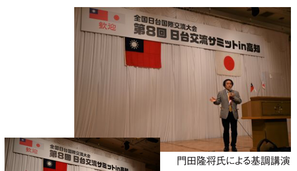
門田隆将氏による基調講演

引き続き、第2部として、歓迎交流 会が同会場で開催されました。明神 健夫高知県議会議長の歓迎あいさつ、 来賓として演田省司高知県知事、古 屋圭司日華議員懇談会会長（衆議院 議員）、向明德台北駐大阪経済文化 弁事処処長、岡崎誠也高知市長の乾