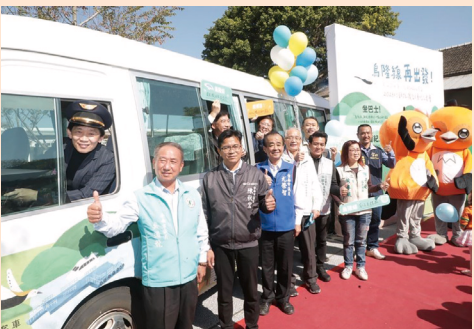
台湾・台南 日本時代と縁あるスポット結ぶ連絡バス運行へ 観光促進に期待＝台南市文化資産管理処

（台南中央社）南部・台南市の文化施設、隆田Chacha園区と景勝地の烏山頭ダム風景区を結ぶ連絡バスが来月1月から運行を開始する。市では地方観光の促進に期待を寄せている。