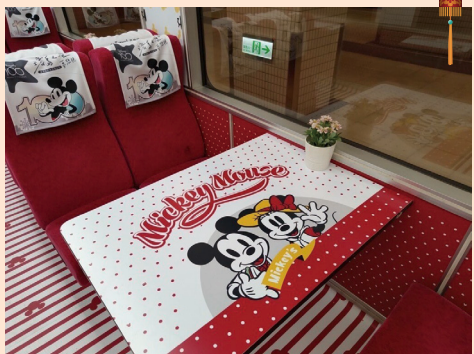
台湾鉄道、ディズニーとコラボの観光列車 19日デビュー

（台北中央社）台湾鉄路管理局（台鉄）は17日、車体や車内にディズニーキャラクターのイラストなどを施した観光列車「環島之星」の車両を報道陣に公開した。19日に運行が開始される。