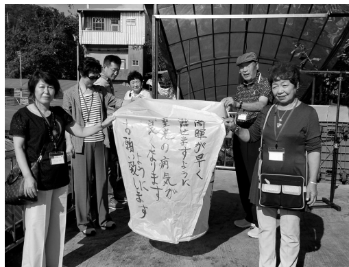
▲願いを書いて空へ飛ばす「天燈上げ」を体験

午前、台北市内観光の後、故宮博物院で中国歴代宮廷の多くの宝物を鑑賞。午後、賞後薬膳鍋料理を堪能した。