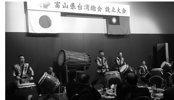
▲盛大に開催された台湾総会設立大会