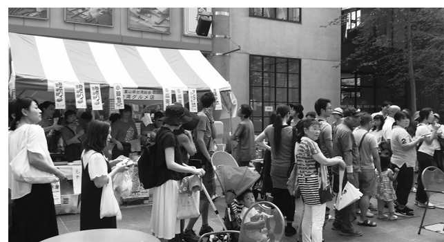
▲マンゴーかき氷の店に長蛇の列