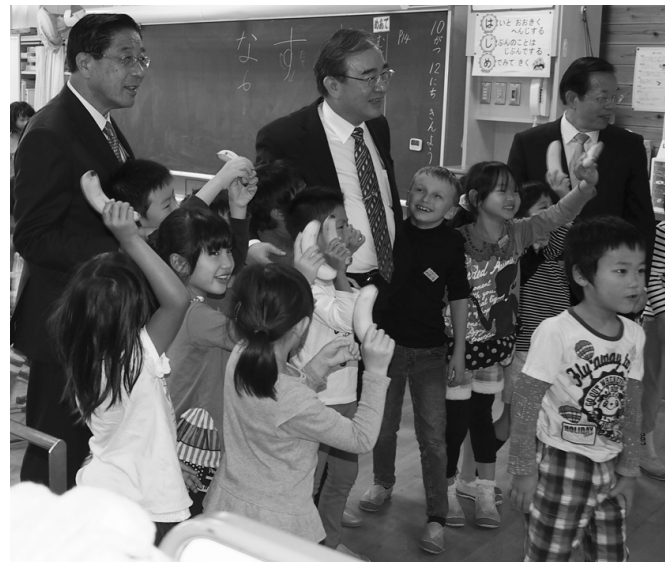
▲バナナを贈られ大喜びの子供たち

甘くて美味しいと言われる台湾バナナ。最近、日本の食卓にあがることが殆どなくなりました。そこで、私たちは日本人、特に子供たちにその味を知ってもらい、同時に台湾も知ってもらって今後の交流促進に繋げていきたい。という思いから「台湾バナナで交流する会」を立ち上げ、会の内外関係企業から協賛を得て「富山市内の全児童に台湾バナナを食べてもらう」企画が実現した。