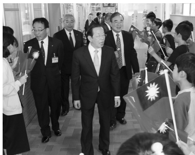
▲児童から大歓迎の謝代表ら一行