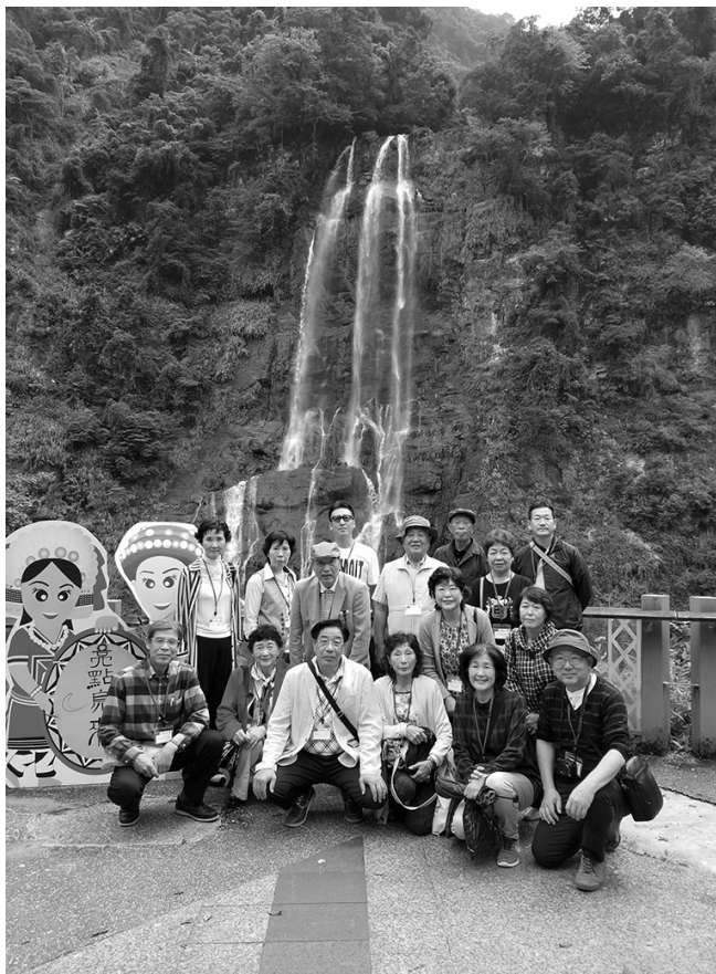
▲大迫力の烏来滝に感嘆

午前、台北郊外の烏来を観光。台湾屈指の落差82mを誇る烏来滝をみたあと、先住民民族タイヤル族の民族衣装をまとった伝統舞踏を鑑賞した。午後、台北市に戻り、ショッピングを楽しんだ。