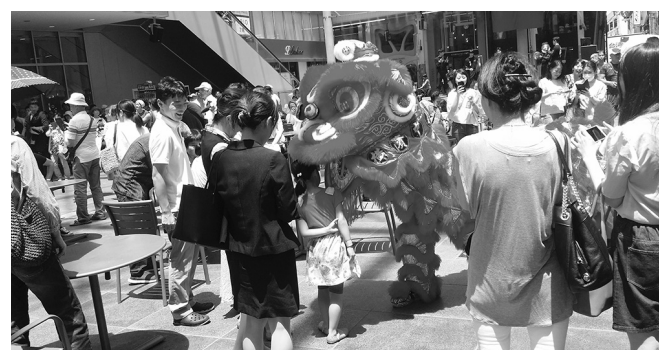
▲多くの来場者で賑わうフェア会場